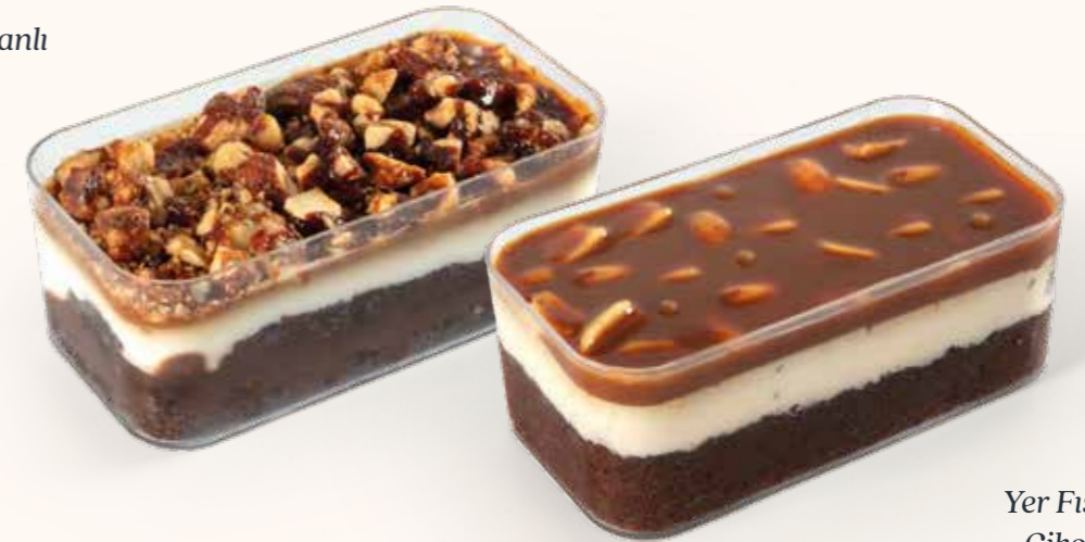
Yer Fıstıklı & Çikolatalı

Gramaj bilgileri ürünün toplam gramajını ifade eder. Kalori bilgileri 100 g üzerinden hesaplanmıştır. Servis edilen ürünler, görseller ile farklılık gösterebilir. Alerjen madde bilgileri en arka sayfada belirtilmiştir.