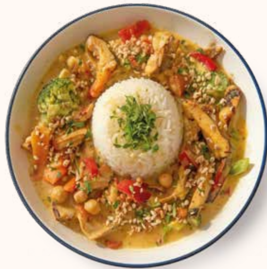
Kremalı Mantarlı Tavuk

Gramaj bilgileri ürünün toplam gramajını ifade eder. Kalori bilgileri 100 g üzerinden hesaplanmıştır. Servis edilen ürünler, görseller ile farklılık gösterebilir. Alerjen madde bilgileri en arka sayfada belirtilmiştir.