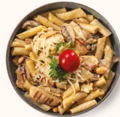
Tavuklu Mantarlı Penne

Gramaj bilgileri ürünün toplam gramajını ifade eder. Kalori bilgileri 100 g üzerinden hesaplanmıştır. Servis edilen ürünler, görseller ile farklılık gösterebilir. Alerjen madde bilgileri en arka sayfada belirtilmiştir.